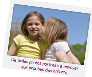
De belles photos portraits à envoyer aux proches des enfants