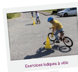
Exercices ludiques à vélo