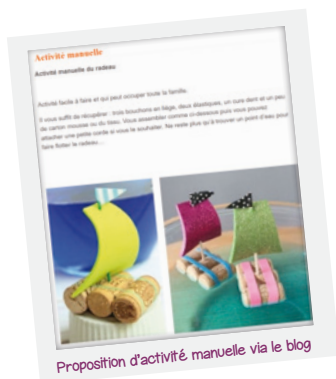
Proposition d'activité manuelle via le blog