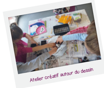
Atelier créatif autour du dessin