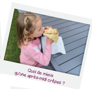
Quoi de mieux qu'une après-midi crêpes ?