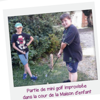
Partie de mini golf improvisée dans la cour de la Maison d'enfant