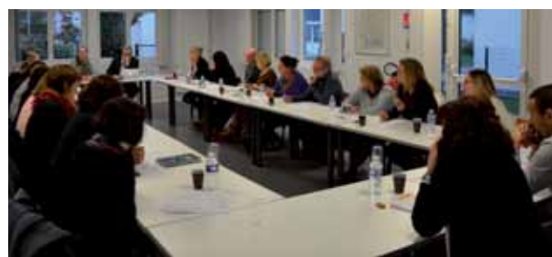
Groupe de travail avec les professionnels de l'association

Nous reviendrons plus en détail sur ce nouveau Projet dans le prochain numéro de notre revue associative.