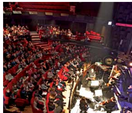
Générale Milo et Maya du 12 janvier

L'association remercie vivement l'Opéra de Rouen Haute-Normandie pour avoir rendu possible ce beau moment.