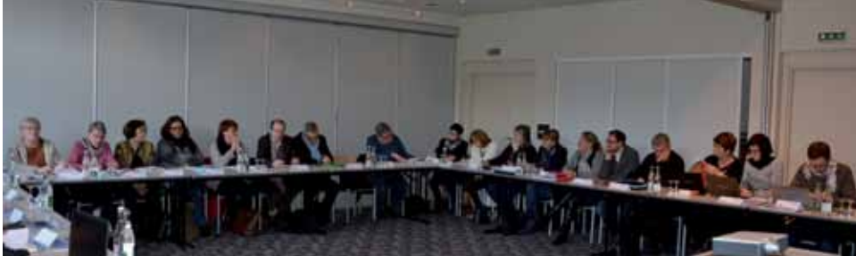
Commission plénière de réécriture du projet associatif

Le Projet de l'association Les Nids 2011-2015 arrivant à son terme, différents travaux ont été organisés pour entreprendre sa réécriture dès la rentrée de septembre 2015. Il s'est agi pour l'association de penser la méthodologie à employer dans le but de fédérer toutes les parties prenantes autour des grands enjeux et défis pour Les Nids et de produire, in fine, la feuille de route d'une volonté partagée. Plusieurs thématiques centrales ont ainsi été discutées : la garantie du respect des droits de l'enfant, les principes fondamentaux de coéducation, l'insertion des jeunes, l'ouverture sur l'environnement et la prise en compte du