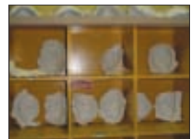
Préparation, angoisse, concentration